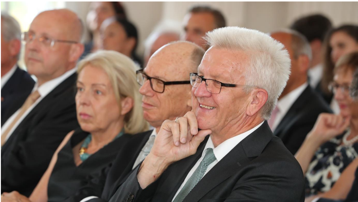
Festakt anlässlich des Amtswechsels des Präsidenten, Schloss Solitude, Juli 2018

Damit liegt die Erfolgsquote im Berichtszeitraum leicht über derjenigen des Bundesverfassungsgerichts in Verfassungsbeschwerdeverfahren. Ausweislich des Geschäftsbericht des Bundesverfassungsgerichts vom Februar 2021 betrug der Anteil der stattgegebenen an den entschiedenen Verfassungsbeschwerden in den Jahren 2011 bis 2020 ca. 1,88 %.